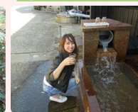
軟水と硬水の2種類の清水が あり、味の違いを飲み比べ ることができます。