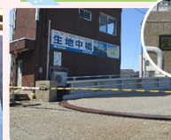
漁船が通過する時、橋の 片側を軸として回転します