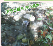
生地で最も古い清水