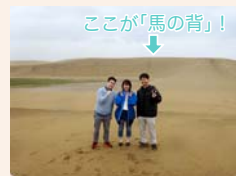
鳥取砂丘は、安全に「スマホ・ゲーム」を楽しめる「スナ(砂)ホ・ゲーム解放区」です！

鳥取に来たら一度は立ち寄りたスポット。東西16km・南北2.4kmに広がり、その中心の146.2haは、日本の砂丘の中では、唯一天然記念物に指定されています。